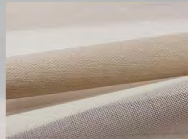
ALVA en FINYA staan voor natuurlijke elegantie.

Een groot gedeelte van de stoffen wordt in Duitsland geweven, geïmporteerd en uitgerust. Dit komt overeen met onze filosofie met betrekking tot korte transportwegen, een strenge kwaliteitscontrole, veiligheid voor de gezondheid en een efficiënte productie welke is gebaseerd op het zoveel mogelijk ontzien van grondstoffen.