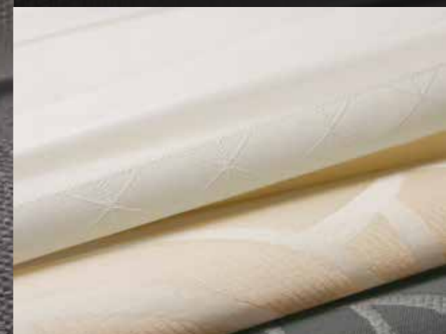
VICTOR en VIOLA zijn jacquarddessins, welke een subtiel effect op het raam tonen.