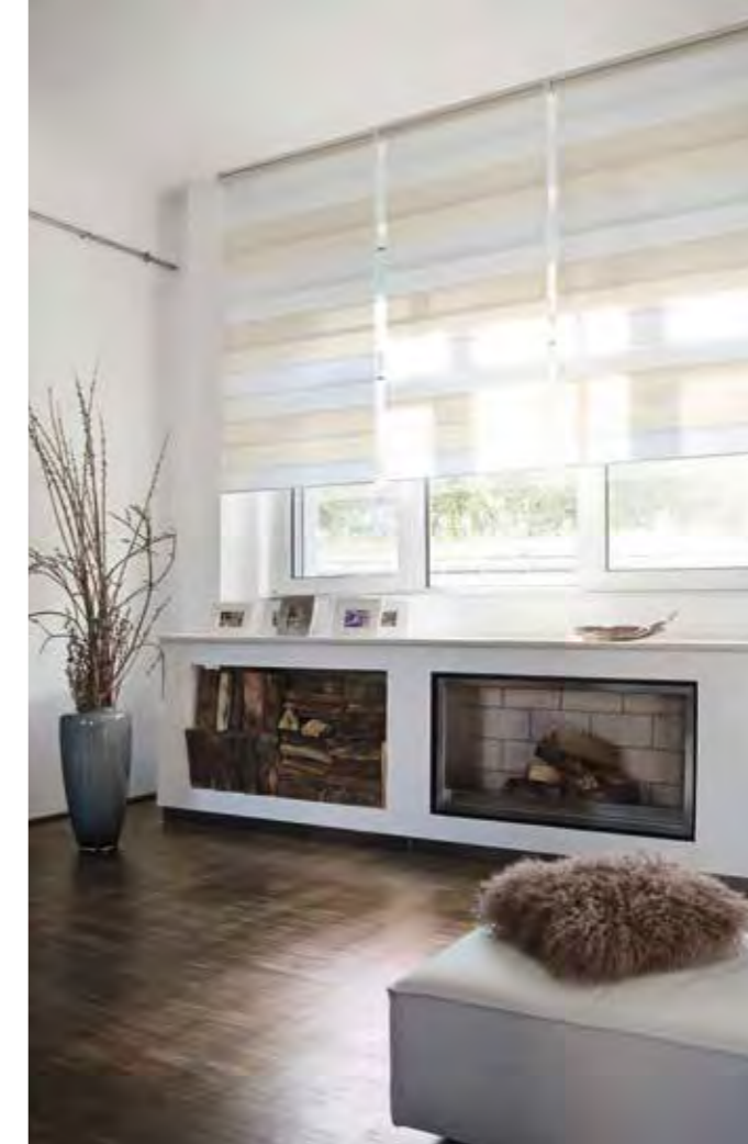
Bijzonder afwisselingsrijk: De kleurige blokstrepen vormen bij een gesloten dessin een tweemaal zo grote streep. .

TWEE VERSCHILLEND KLEURIGE BLOKSTREPEN IN HET DESSIN FINYA VROLIJKEN HET KLASSIEKE STREEP-DESSIN OP.