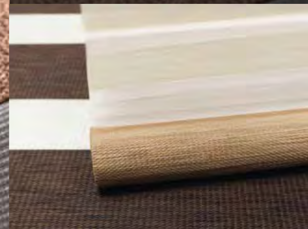
MALIN, MOA en LIV blijven bijzonder dicht bij de natuur.